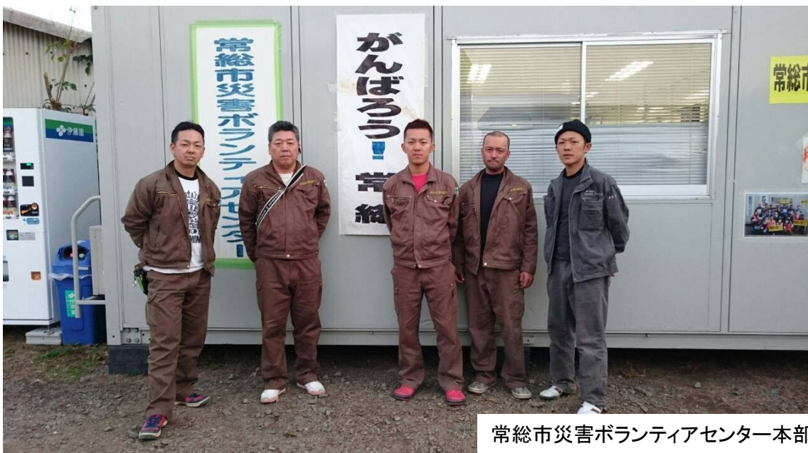
常総市災害ボランティアセンター本部